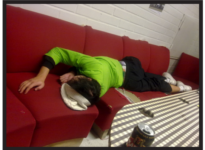
Pubirundi klo 18:xx.

Edessä hämmöittävä Skillan, Telen ja Hiukkasan järjestämä fuksisuunnistus pakotti suunnistusjoukkueemme kokoontumaan asujen suunnittelun merkeissä, ja innostuneena syntyneistä ideoista joukkueemme säntäsikin heti keskustaan mylläämään kirpputori-kojuja. Ennen kuin hurja joukkomme päästettiin valloilleen etsimään rasteja, oli aika luovuttaa, nimittäin verta. Armottoman ristikuulustelun ja kaavakekasan täytön jälkeen sängylle pääsi makaamaan piikin jatkeeksi. Kun ajatukseen puuttuvasta verimäärästä oli